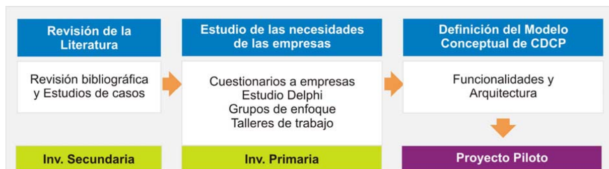
Figura 1. Metodología del estudio

La metodología llevada a cabo para la realización del presente estudio involucró las tres fases que se observan en la figura 1.